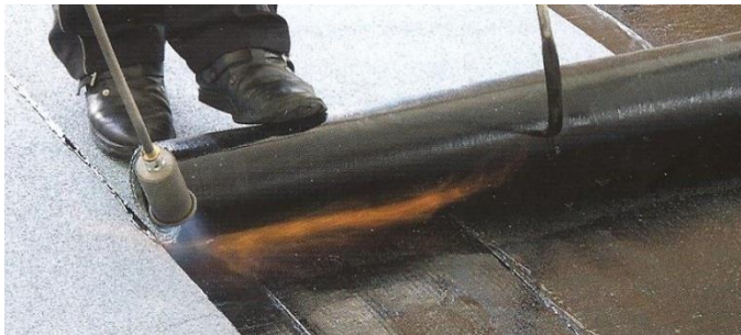
Natavování s navijčem rolí rozbalovačem rolí